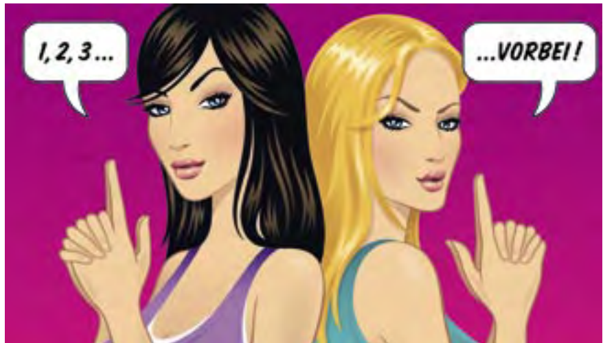
Postkartenmotiv für KadeFungin gegen Pilzinfektion

auch Sonderdrucke mit Duftproben, Beflockungen, Ausstanzungen oder Lentikularkarten (Wackelbilder). Karten mit Logos, Webadressen oder Abbildungen, die auf den ersten Blick nach Werbung aussehen, sind weniger beliebt. Wichtig ist außerdem, dass die Rückseite nicht mit Informationen überladen ist, so dass sie nicht mehr beschrieben werden kann.